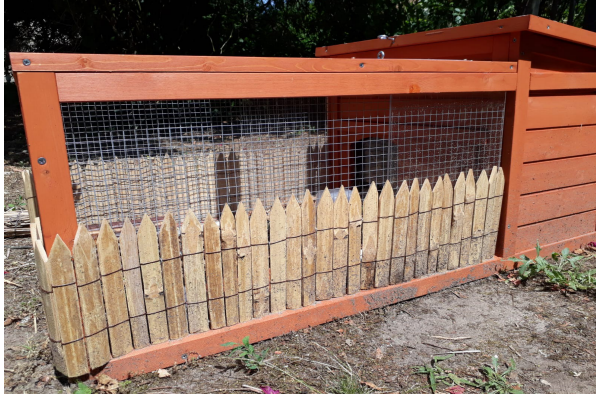
Mettre une bordure en bas pour obstruer la vue pour pas qu'elle voit l'herbe de l'autre coté

- Mettre une paillasse ou un parasol au dessus du parc, en cas de grosse chaleur « canicule ».