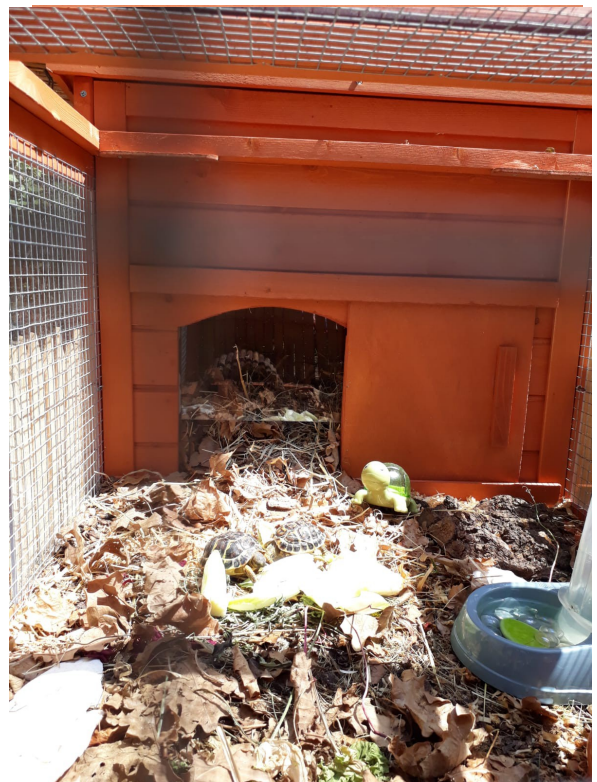
vue extérieur dans le parc de la

Aménagement intérieur coupelle d'eau, ou abreuvoir pour chat, cachette bois ou pot retourné mettre 2/3 cm de terre de jardin ou copeaux fin.