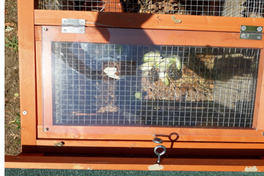
Mettre un plexi sur le grillage pour faire effet serre et sur les cotés aussi