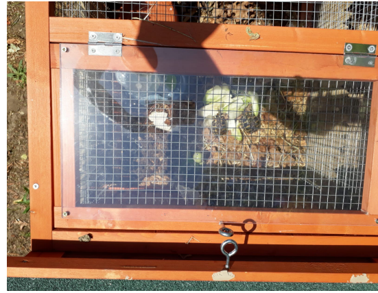
Mettre un plexi sur le grillage pour faire effet serre et sur les cotés aussi