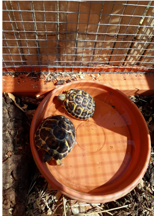
coupelle d'eau ou abreuvoir pour chat enterrée là un peu et vérifier que la tortue peu y sortir facilement si non mettre des galets ou autre