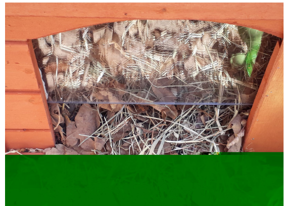
vue extérieur dans le parc de la maison