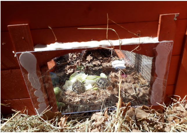
Mettre une bordure en bas pour obstruer la vue pour pas qu'elle voit l'herbe de l'autre côté