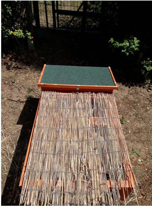
Paillasse pour protéger de grosse chaleur ou protéger avec un parasol