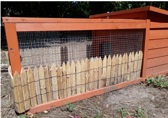
Fermer la porte par un plexiglas ou bois vue intérieur